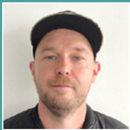
Mike Eilers Presswerk