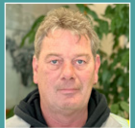
Günter Klüver Logistik