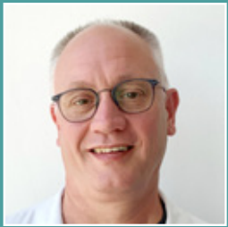
Dietmar Emkes Presswerk