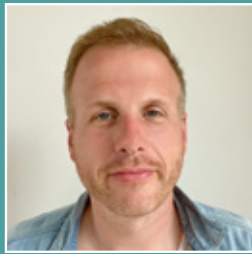
Philipp Voigt Logistik