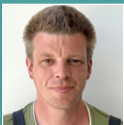
Jörg Hellmers Logistik