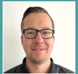
Dennis Iwwerks-Hinrichs Presswerk