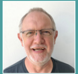
Wolfgang Biermann Logistik