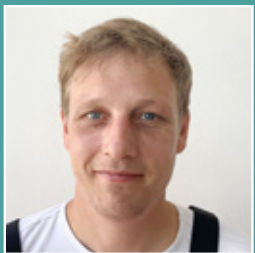
Jens Groeneveld Transport