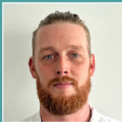
Torben Petersen Presswerk