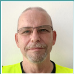
Eberhard Hasser Logistik