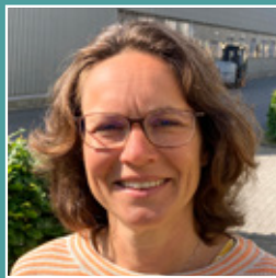
Silvia Hommer Gesundheitszentrum