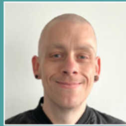
Reinhard Thiele Presswerk